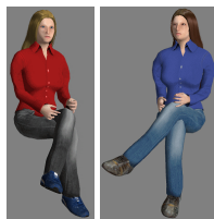
GT Frau 02 rot (blau)