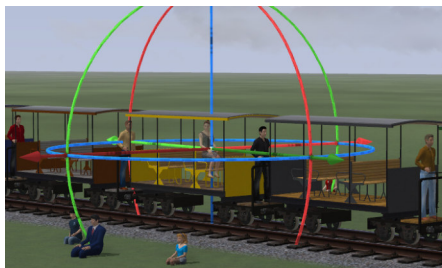
Plazierung der Figur mit Hilfe des Gizmo in auf die Sitzfläche.