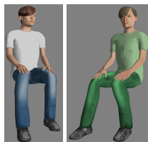
GT junger Mann 01 (grün)