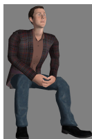
GT Mann 03