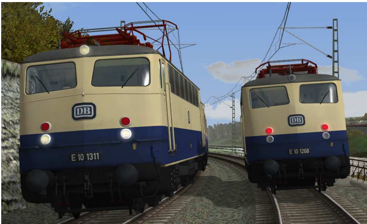
Beleuchtung: 2-Licht-Zugschluß- (rechts) und 3-Licht-Spitzensignal (links)

Die Beleuchtung wechselt fahrtrichtungsabhängig von Dreilichtspitzensignal auf 2-Licht-Zugschlußsignal. Auf der gekuppelten Seite ist das Licht ausgeschaltet.