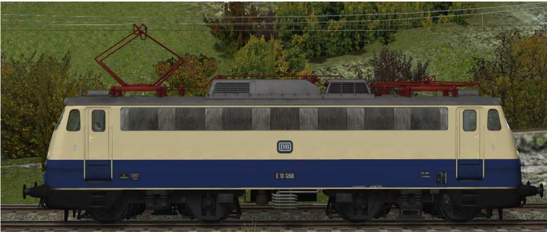
Stromabnehmer: Stromabnehmer 2 angehoben, Stromabnehmer 1 gesenkt

Die beweglichen Stromabnehmer können manuell oder über Kontaktpunkt angehoben und abgesenkt werden.