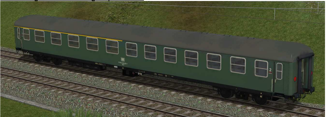
erste / zweite Klasse Reisezugwagen der Gattung Abüm224 in EpIVa