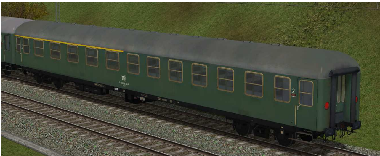
erste / zweite Klasse Reisezugwagen der Gattung ABm223 in EpIV