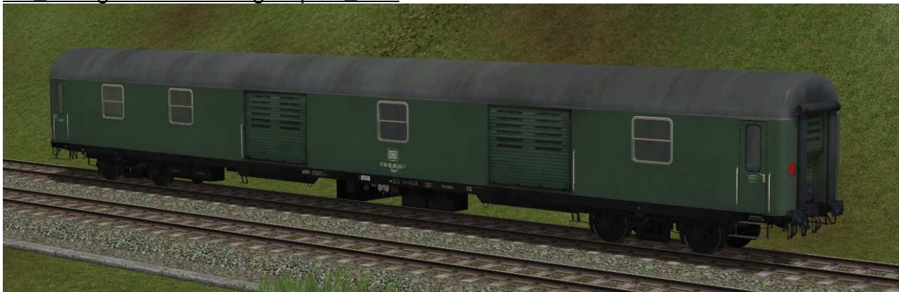
Gepäckwagen der Gattung Düms905 in EpIVa