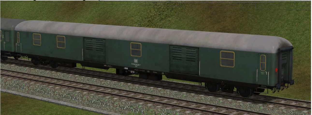
Gepäckwagen der Gattung Dms902 in EpIV