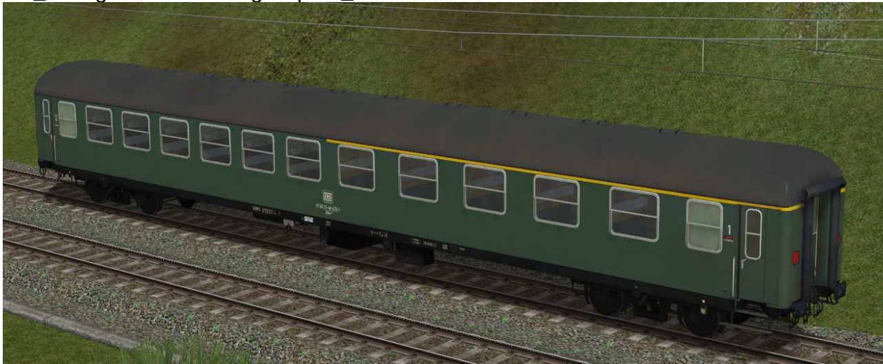
erste / zweite Klasse Reisezugwagen der Gattung Abum225 in EpIVa