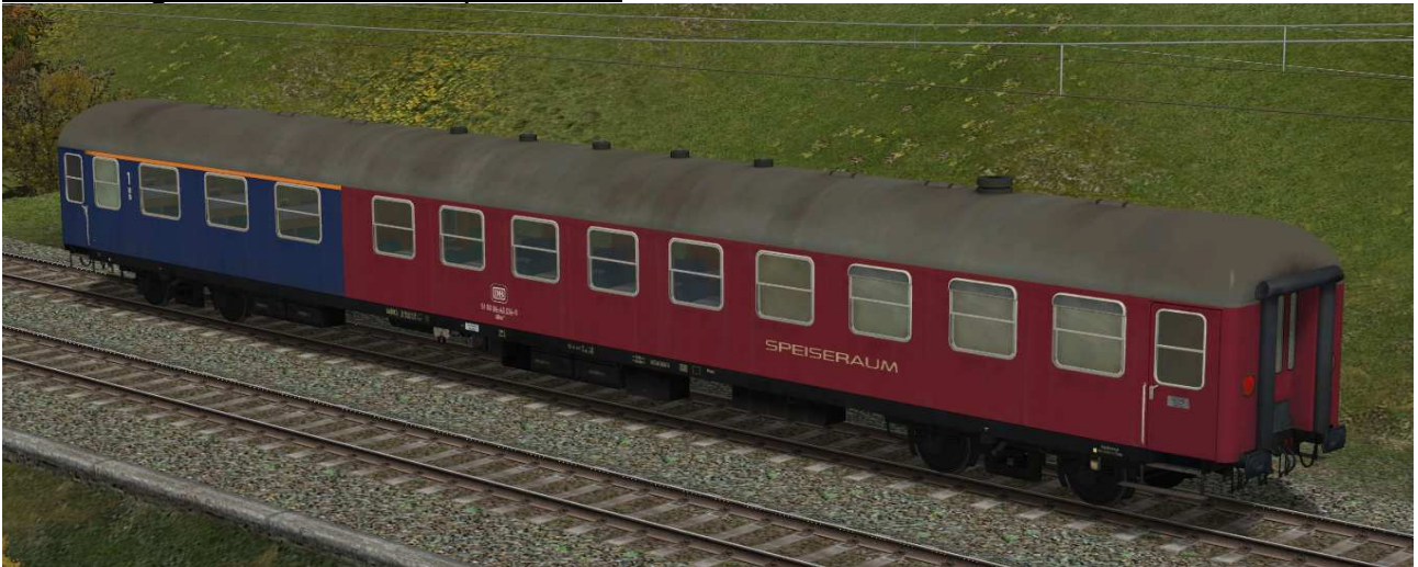
I Speisewagen mit Sitzbereich erster Klasse der Gattung ARm216 in EpIV, zweite Modernisierungsstufe