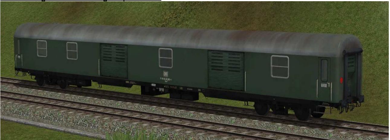
Gepäckwagen der Gattung Dms905 in EpIV