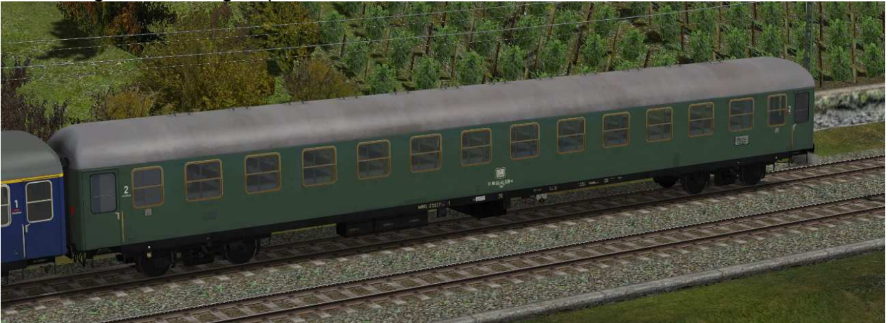
Sitzwagen zweite Klasse, Gattung Bm233, Bauserie1962, erste Umbaustufe