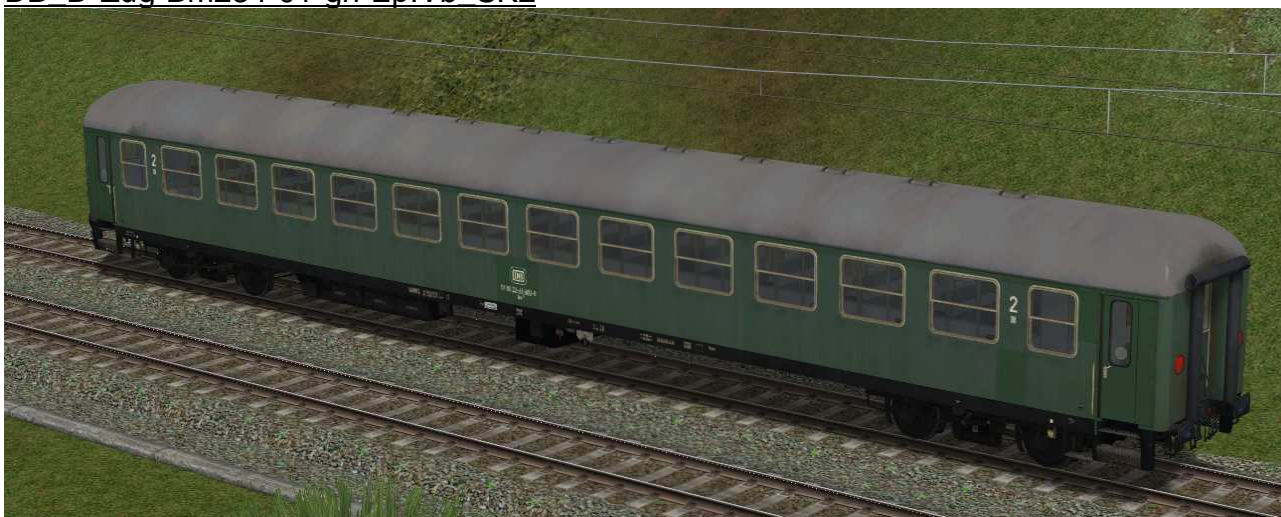
zweite Klasse Reisezugwagen der Gattung Bm234 in EpIVb