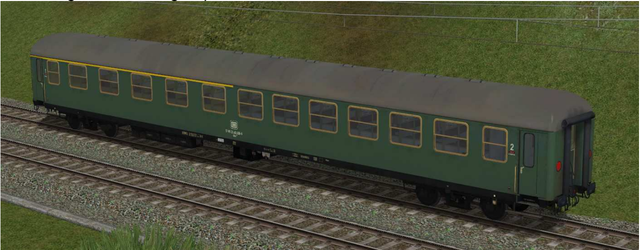
erste / zweite Klasse Reisezugwagen der Gattung ABm225 in EpIV