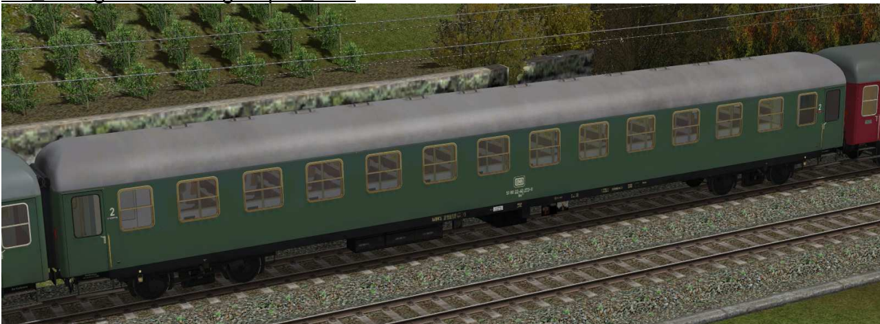
Sitzwagen zweite Klasse, Gattung Bm234, Bauserie 1963, erste Umbaustufe