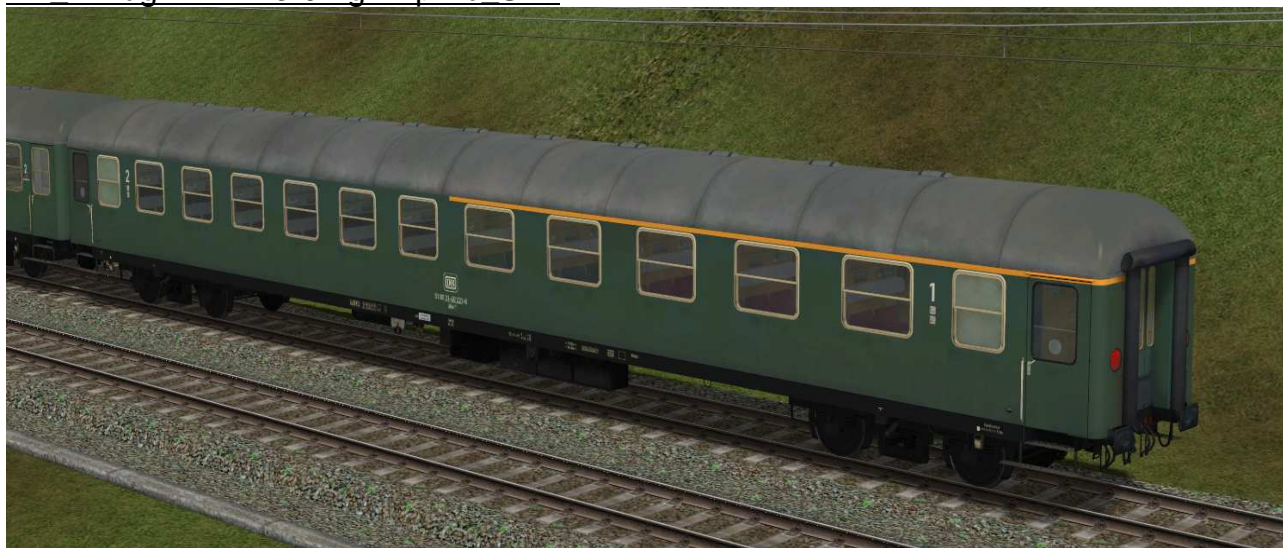
erste / zweite Klasse Reisezugwagen der Gattung ABm223 in EpIVb