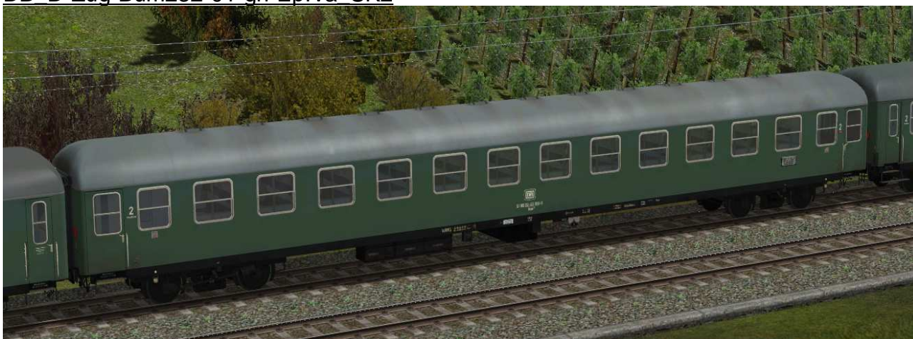
Sitzwagen zweite Klasse, Gattung Büm232, Bauserie 1955