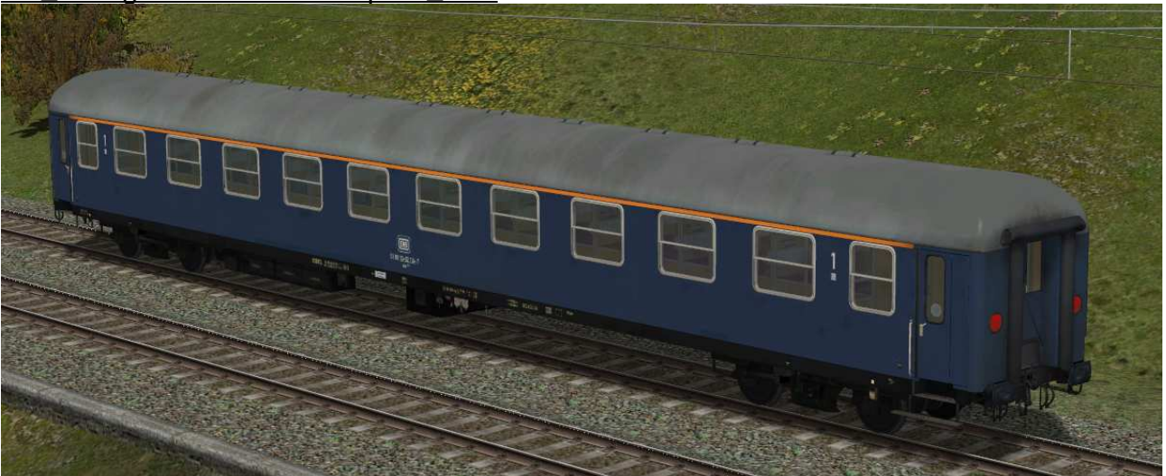
erste Klasse Reisezugwagen der Gattung Am203.1 in EpIVb, Vmax: 200 km/h, meist Verstärkungswagen in IC-Zügen