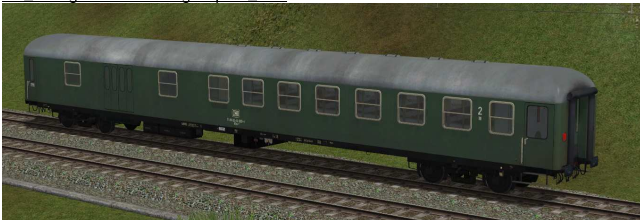
kombinierter Sitz-/Gepäckwagen der Gattung BDms272 in EpIVb