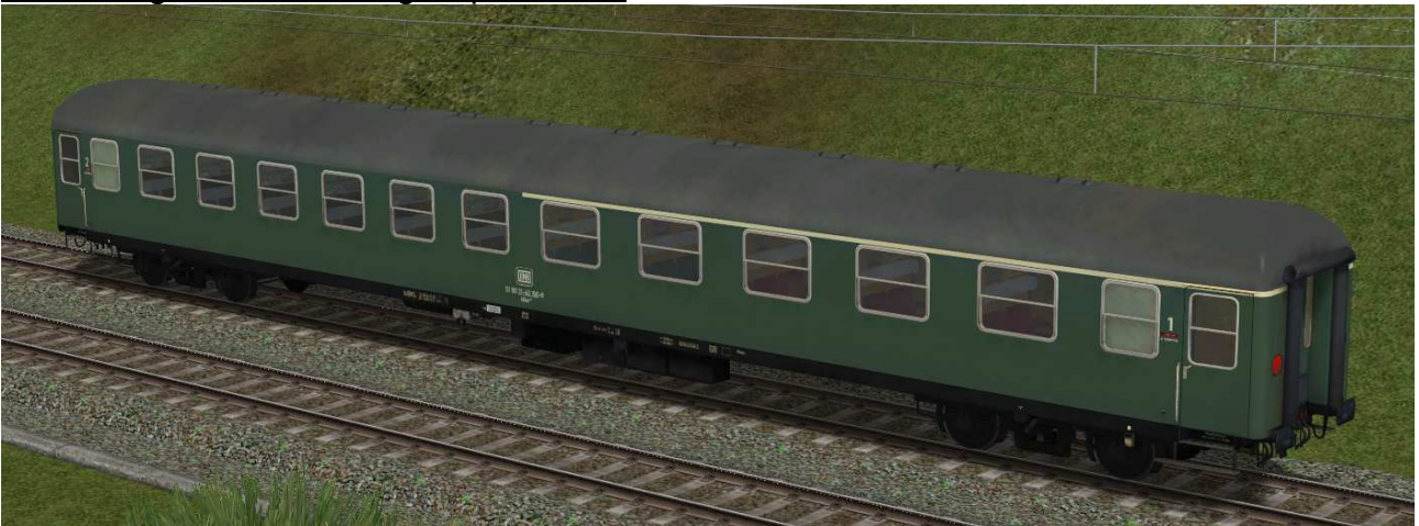
erste / zweite Klasse Reisezugwagen der Gattung Abüm223 in EpIVa