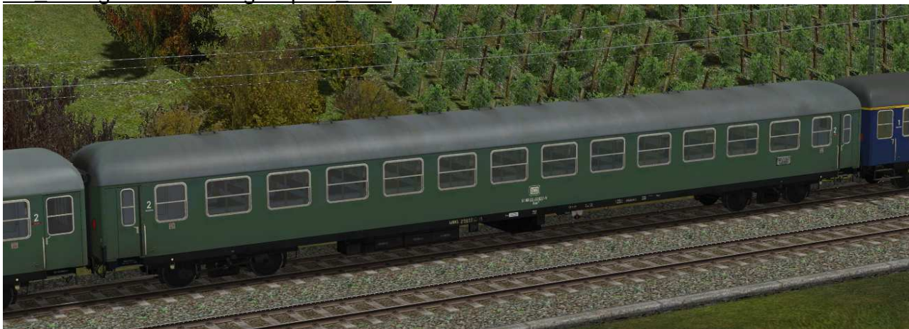
Sitzwagen zweite Klasse, Gattung Büm234, Bauserie 1963