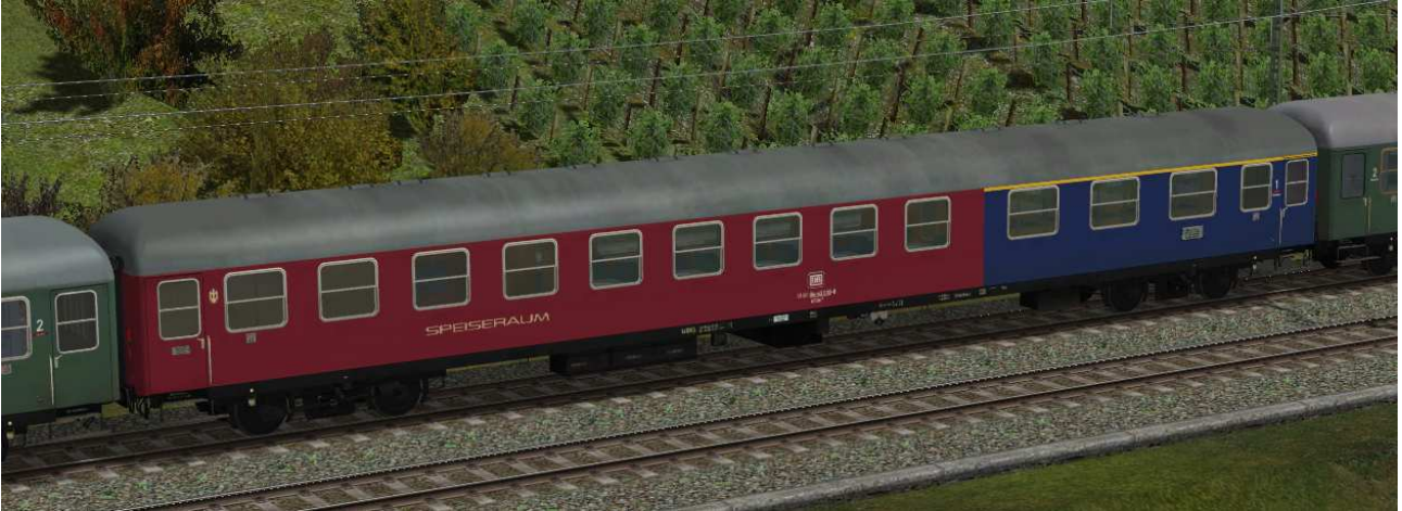
Sitzwagen erste Klasse mit Speiseabteil und Küche, Gattung Arüm216, Bauserie 1954