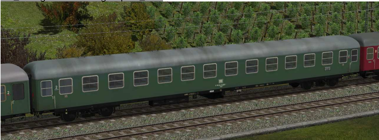
Sitzwagen zweite Klasse, Gattung Büm233, Bauserie 1962