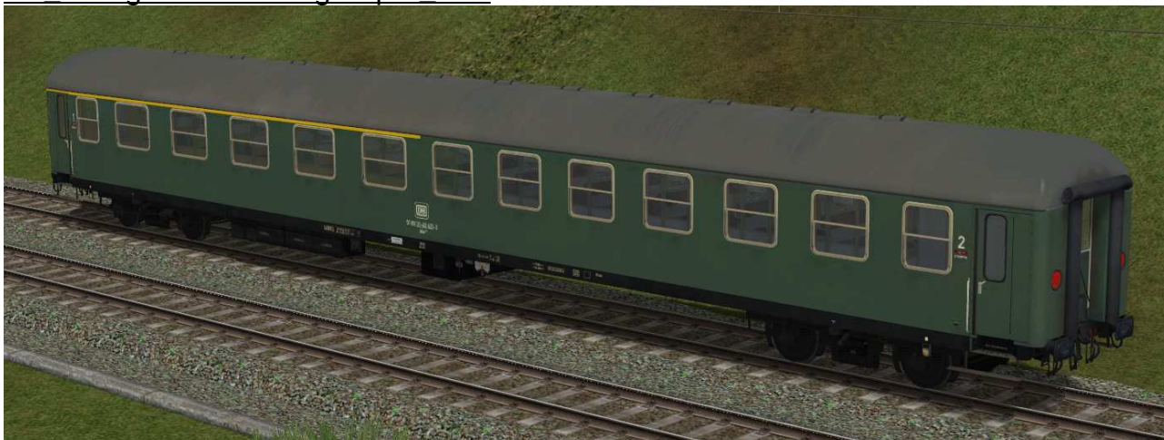
erste / zweite Klasse Reisezugwagen der Gattung ABm224 in EpIV