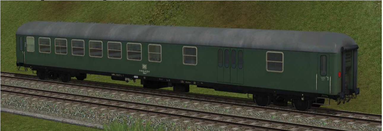
kombinierter Sitz-/Gepäckwagen der Gattung BDm273 in EpIV