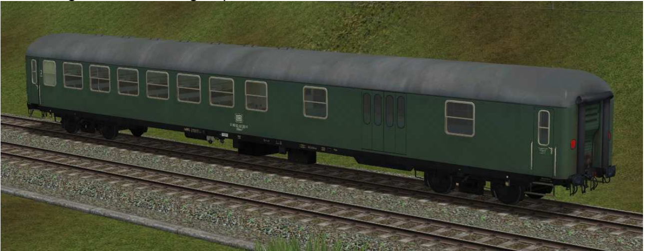
kombinierter Sitz-/Gepäckwagen der Gattung BDüms273 in EpIVa