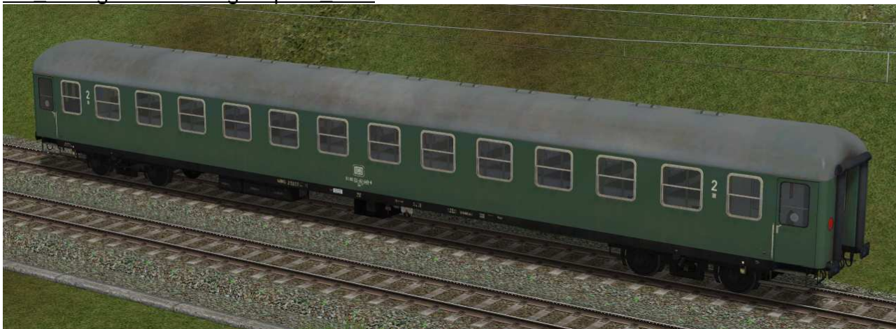
zweite Klasse Reisezugwagen der Gattung Bm232 in EpIVb