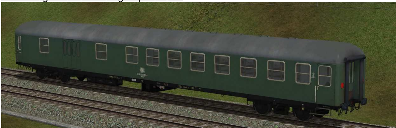
kombinierter Sitz-/Gepäckwagen der Gattung BDüms272 in EpIVa