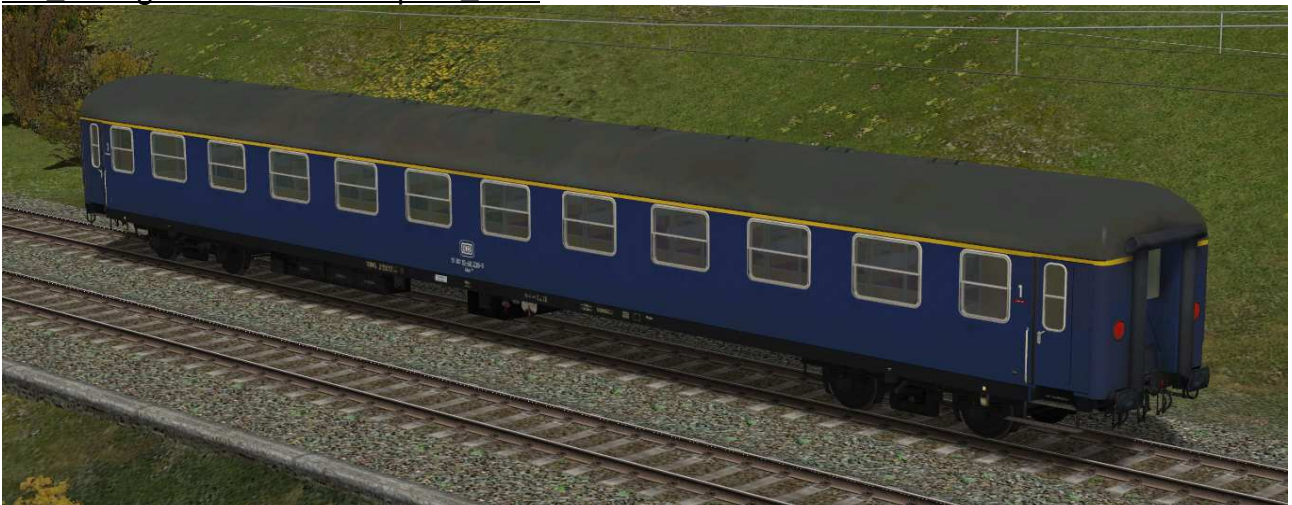
erste Klasse Reisezugwagen der Gattung Aüm203 in EpIVa