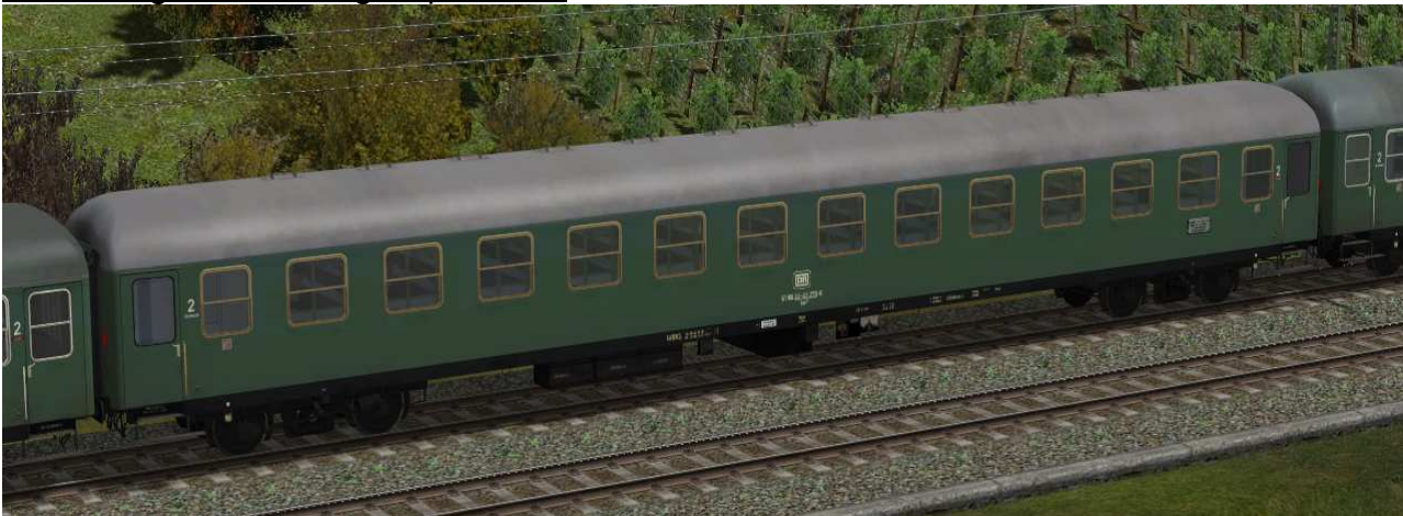
Sitzwagen zweite Klasse, Gattung Bm232, Bauserie 1955, erste Umbaustufe