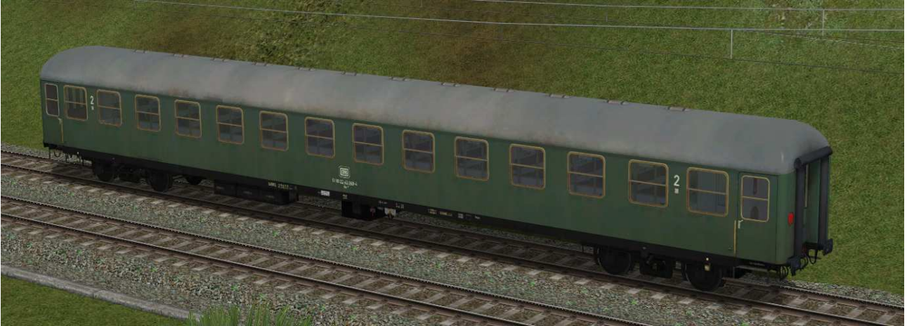
zweite Klasse Reisezugwagen der Gattung Bm239 in EpIVb