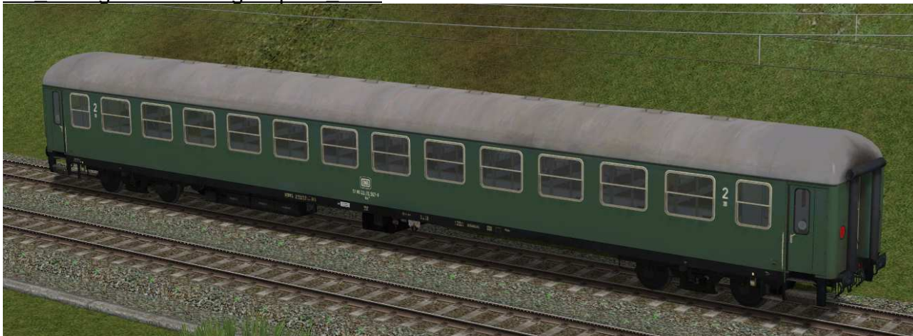
zweite Klasse Reisezugwagen der Gattung Bm234 in EpIVb