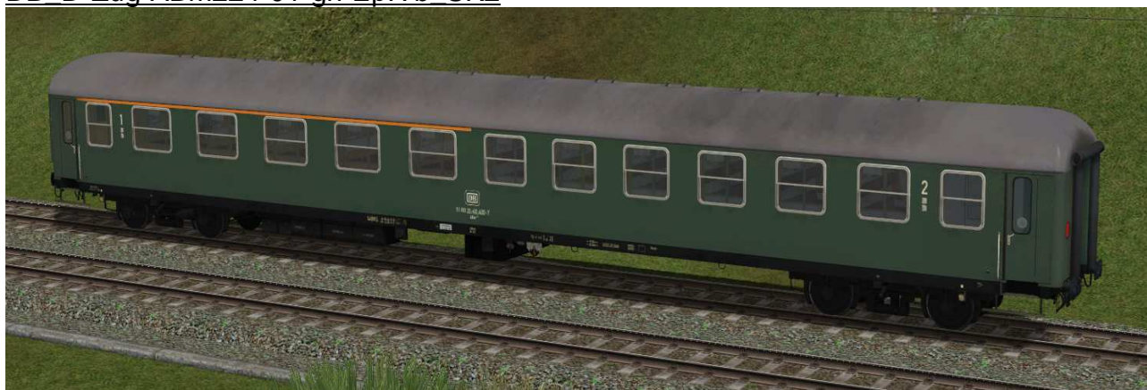
erste / zweite Klasse Reisezugwagen der Gattung ABm224 in EpIVb