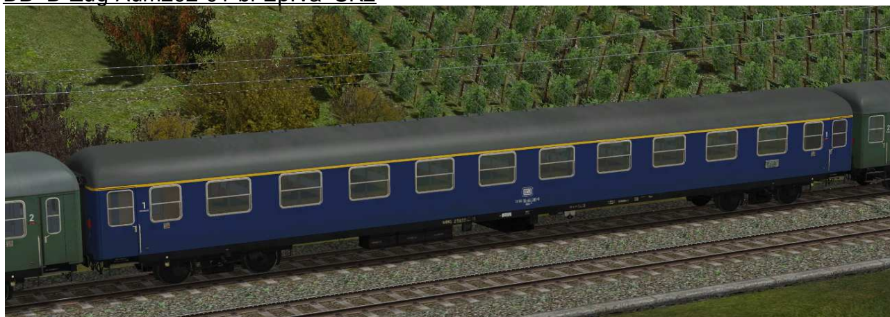
Sitzwagen erste Klasse, Gattung Aüm202, Bauserie 1954