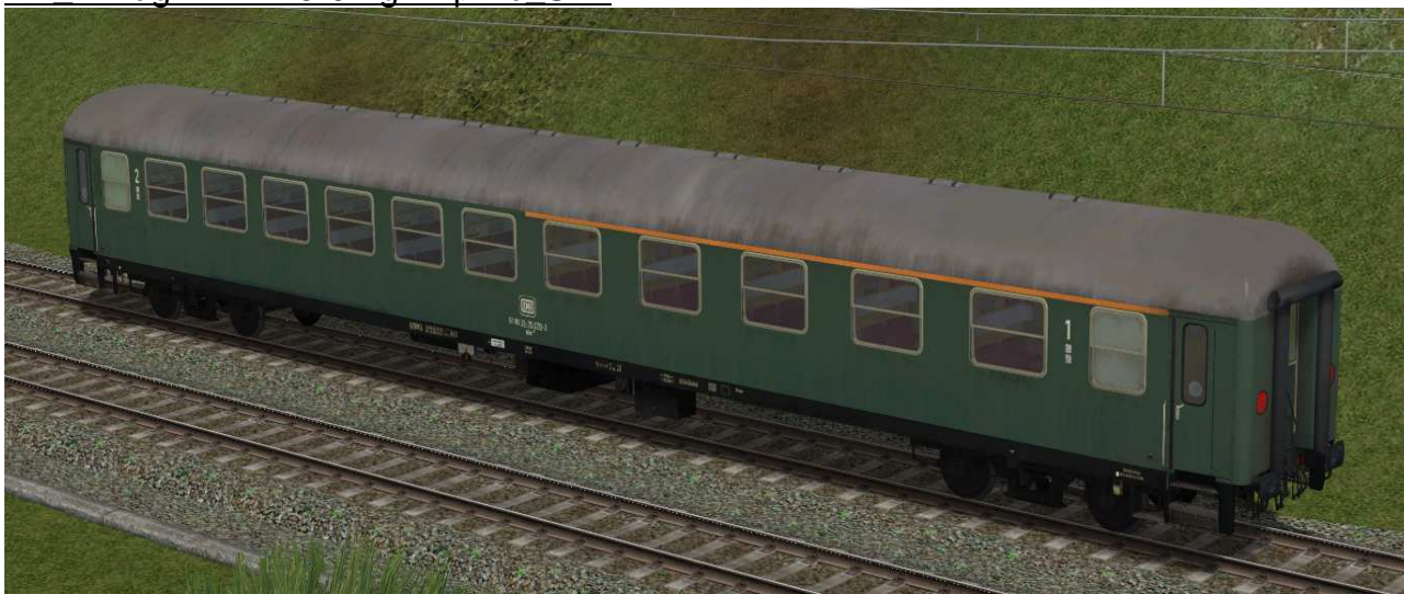
erste / zweite Klasse Reisezugwagen der Gattung ABm225 in EpIVb