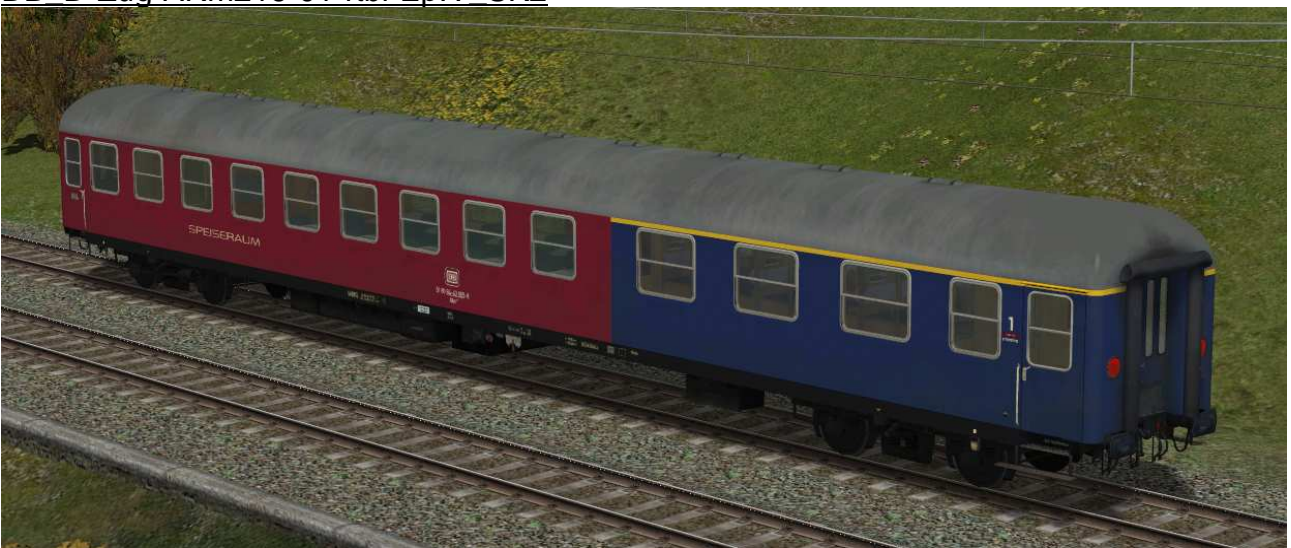
Speisewagen mit Sitzbereich erste Klasse der Gattung ARm216 in EpIV, erste Modernisierungsstufe