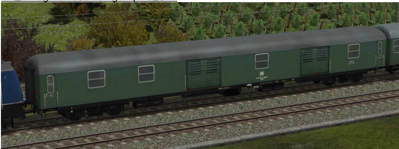
Gepäckwagen mit Seitengang Düms902, Bauserie 1960