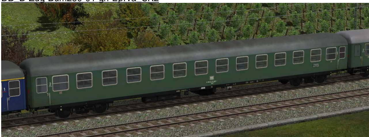
Sitzwagen zweite Klasse, Gattung Büm239, Umbau aus Bcm241 und 251, 1966