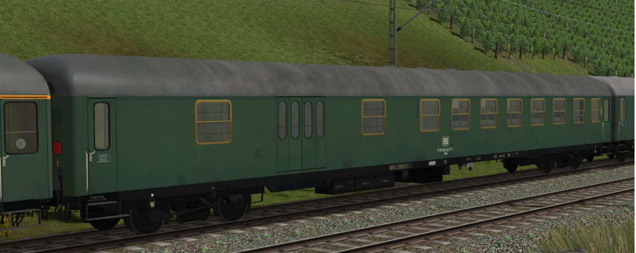
kombinierter Sitz-/Gepäckwagen der Gattung BDm272 in EpIV