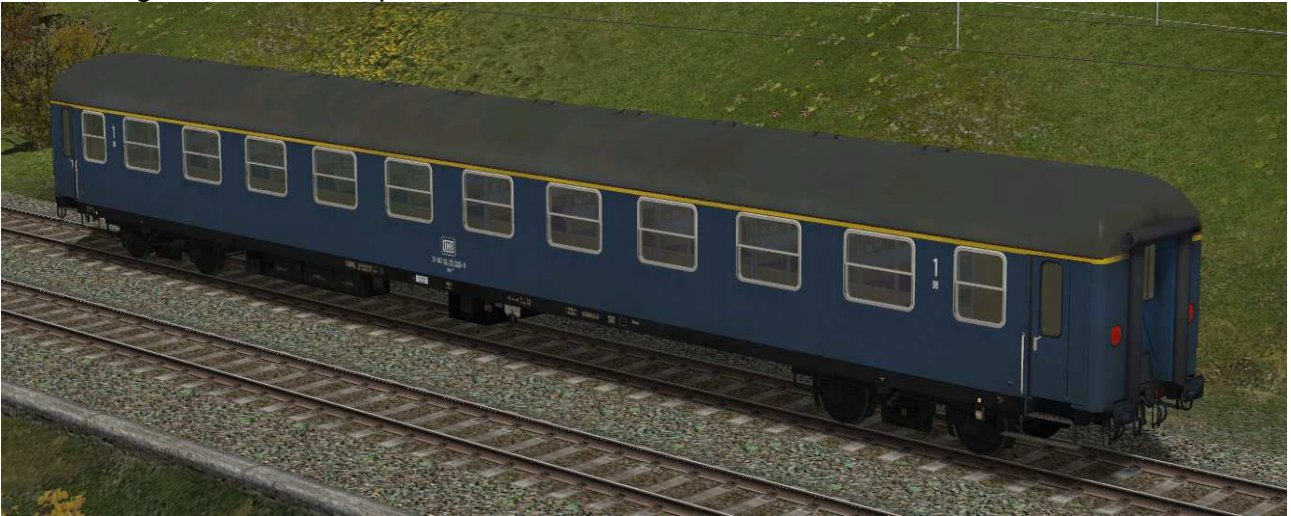
erste Klasse Reisezugwagen der Gattung Am203 in EpIVb