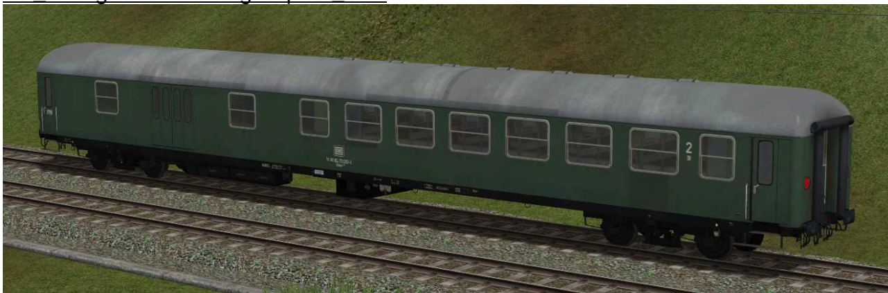
kombinierter Sitz-/Gepäckwagen der Gattung BDms273 in EpIVb