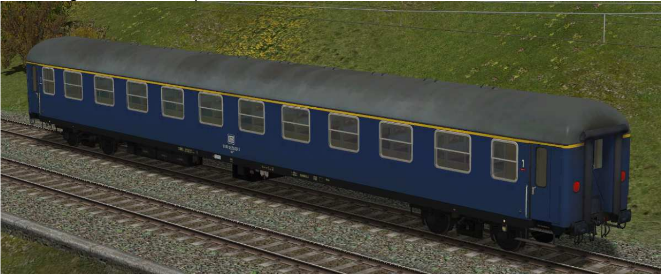
erste Klasse Reisezugwagen der Gattung Am203 in EpIV