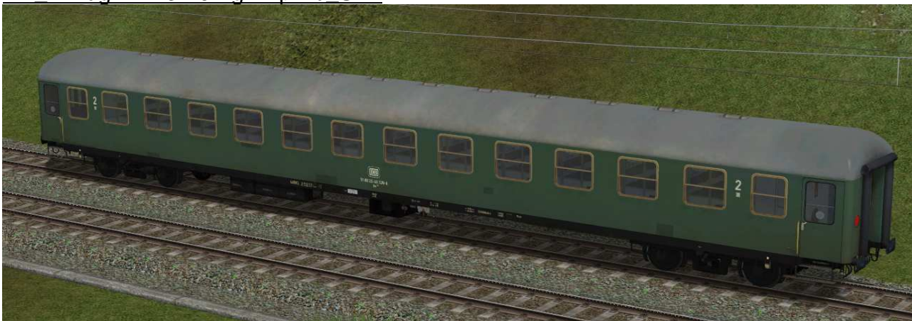
zweite Klasse Reisezugwagen der Gattung Bm232 in EpIVb