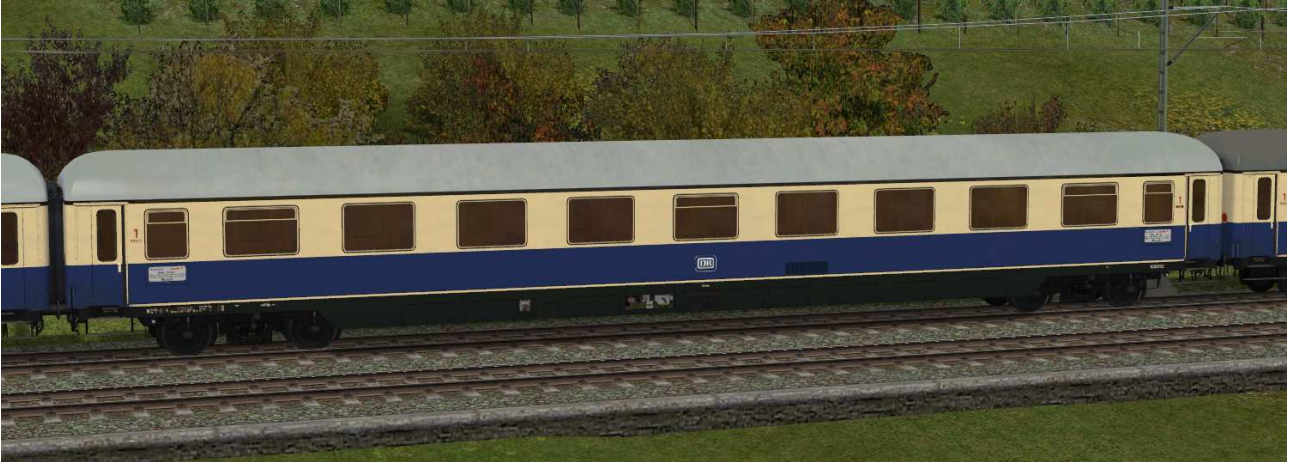
Abteilwagen erster Klasse