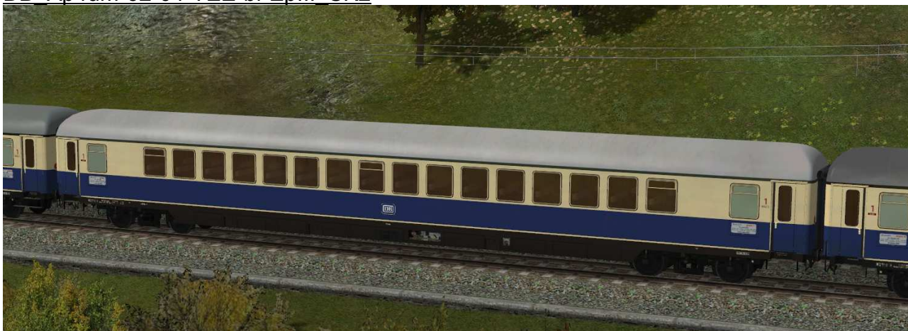
Großraumwagen erster Klasse