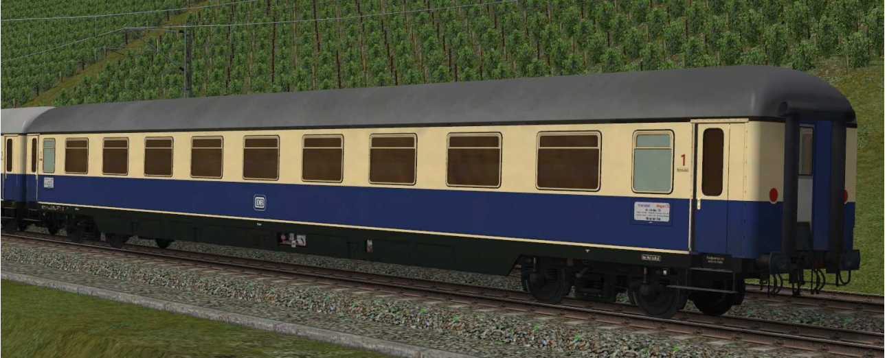
Abteilwagen erster Klasse