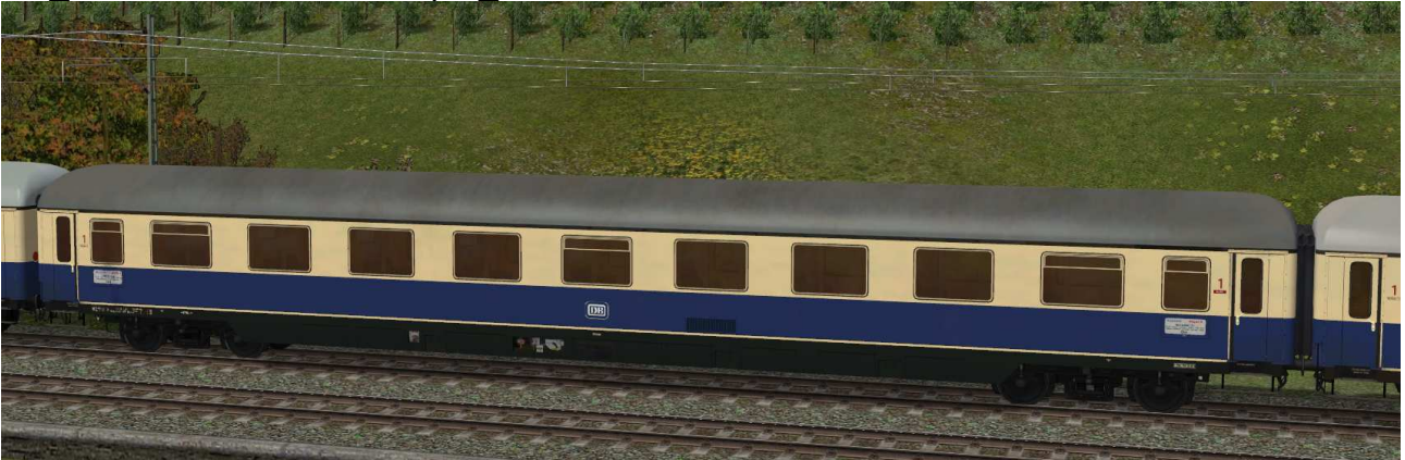
Abteilwagen erster Klasse