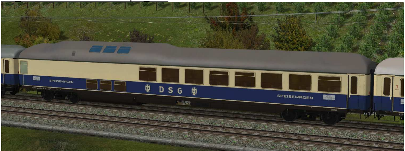
Doppelstockspeisewagen Baujahr 1962