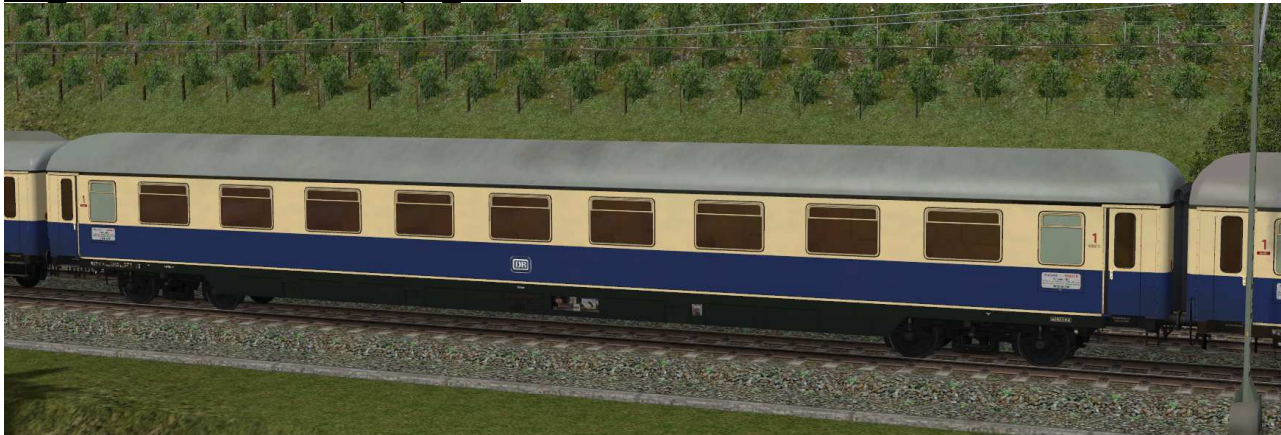
Abteilwagen erster Klasse