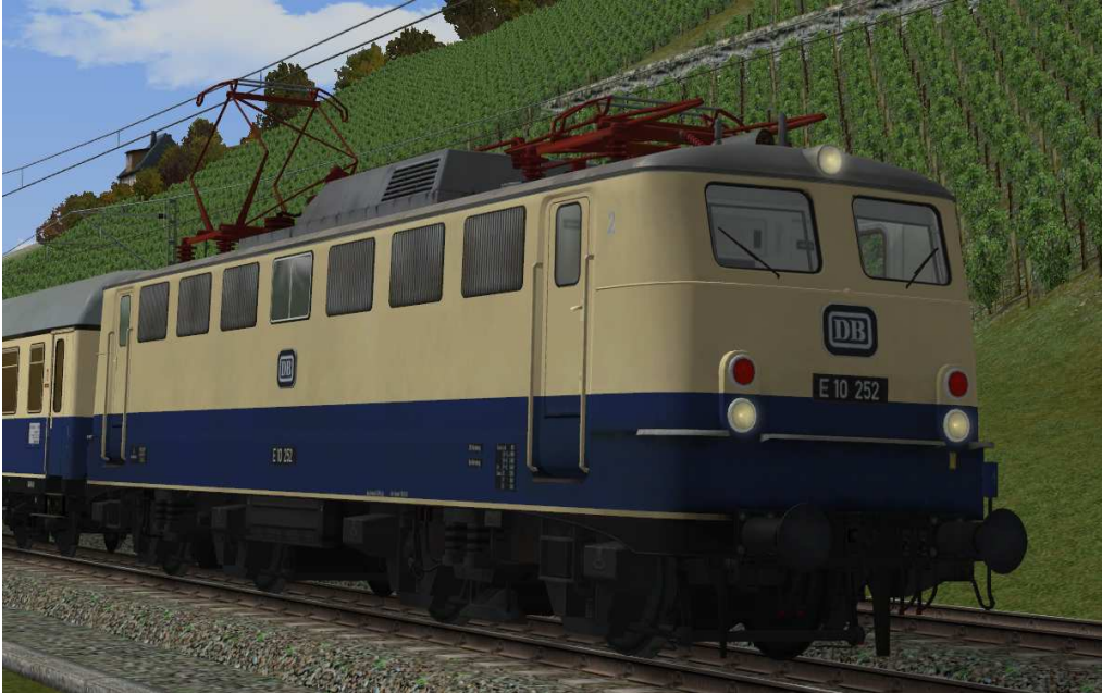
Baujahr: 1962 - Rheinfeil-Zuglok