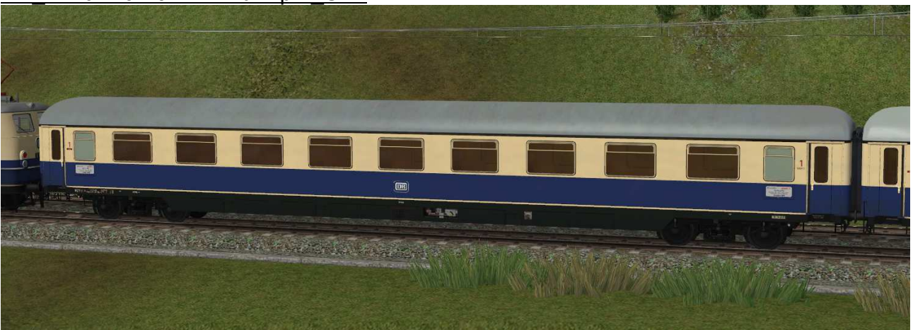
Abteilwagen erster Klasse