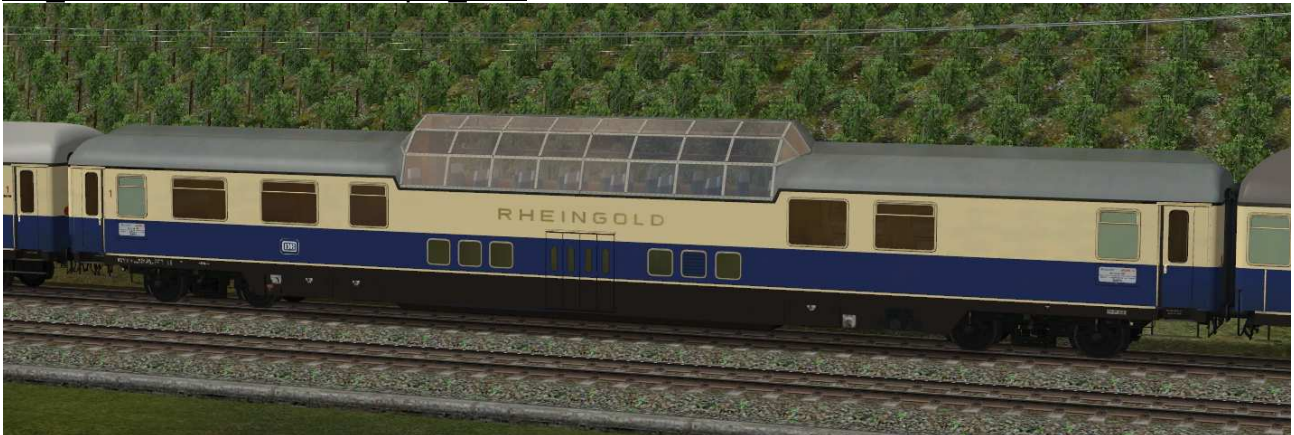
Aussichtswagen der ersten Bauserie 1962