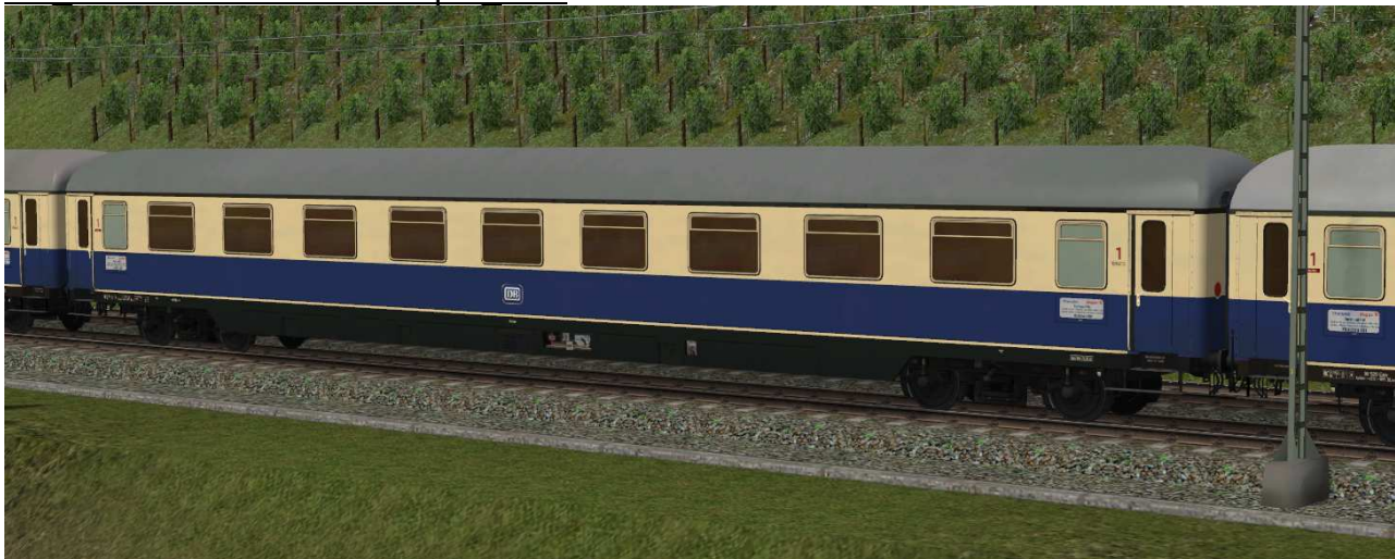
Abteilwagen erster Klasse