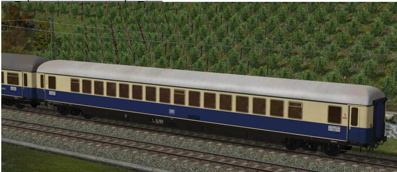
Großraumwagen erster Klasse