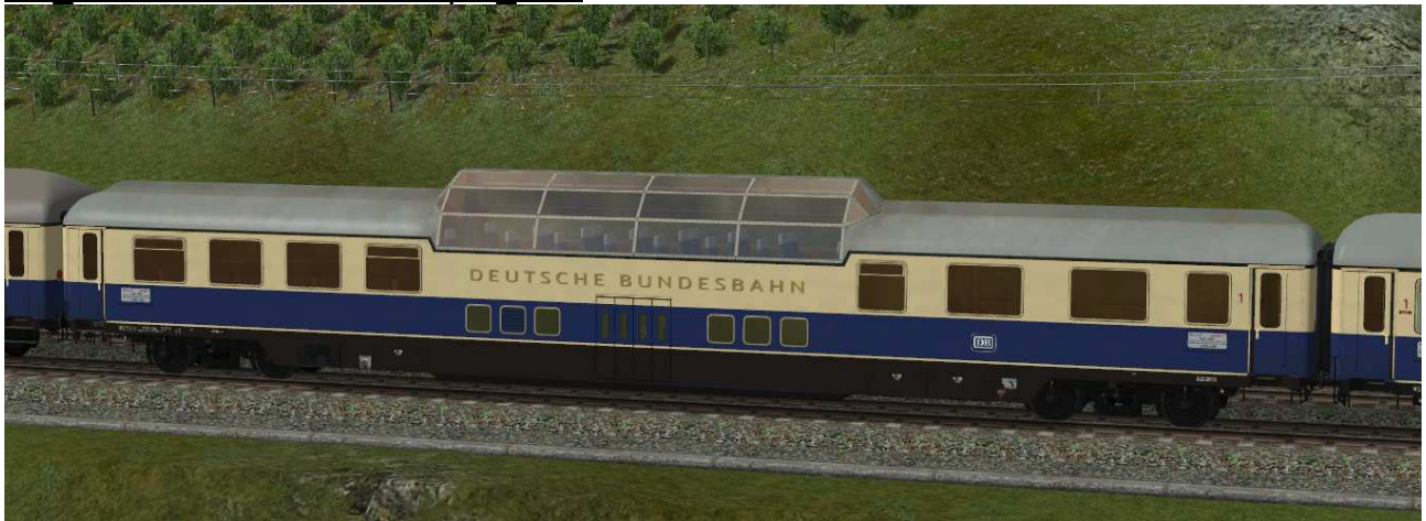
Aussichtswagen der ersten Bauserie 1963