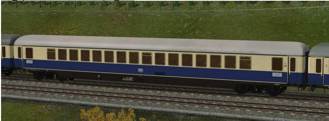
Großraumwagen erster Klasse