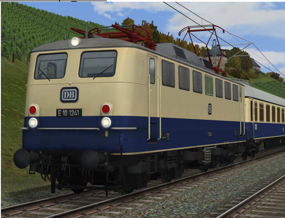
Baujahr: 1962 - Rheingold-Zuglok

Die Beschreibungen zu den Modellen entnehmen Sie bitte aus den entsprechenden Dokumentationen der Lokomotiven.