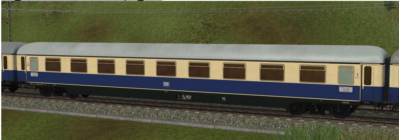
Abteilwagen erster Klasse