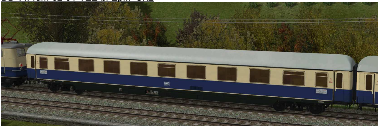
Abteilwagen erster Klasse