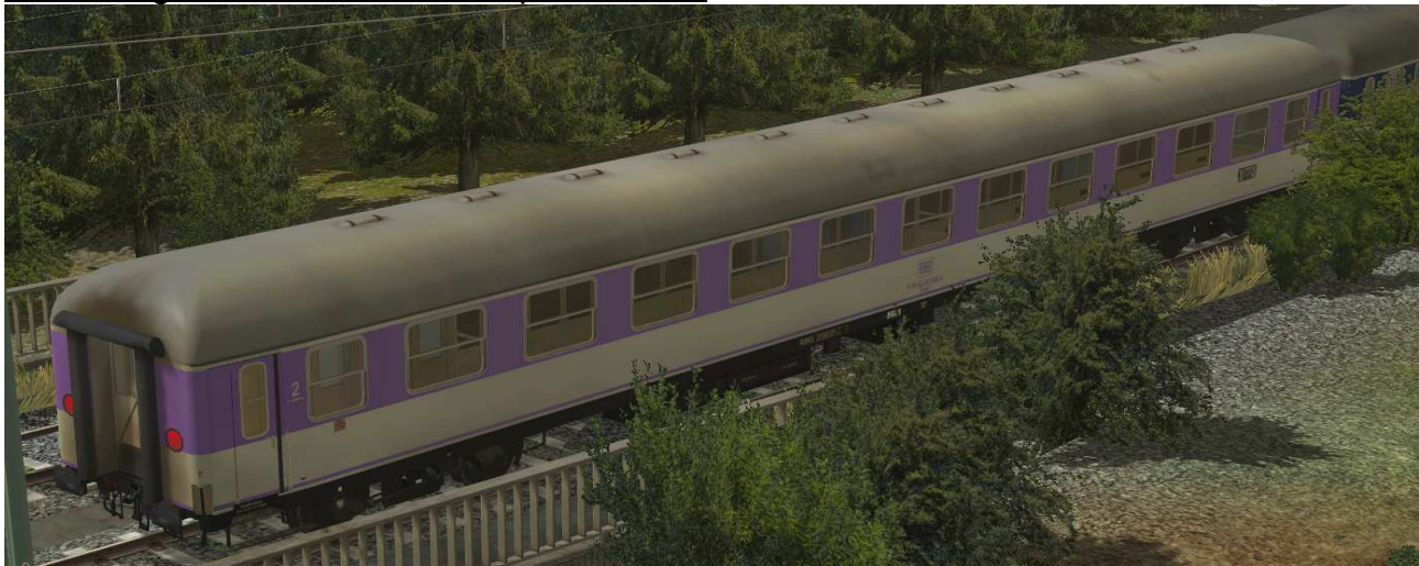
Liegewagen der Gattung Bcüm243 POP-Lackierung blau-lila (Sonderlackierung) in EpIV