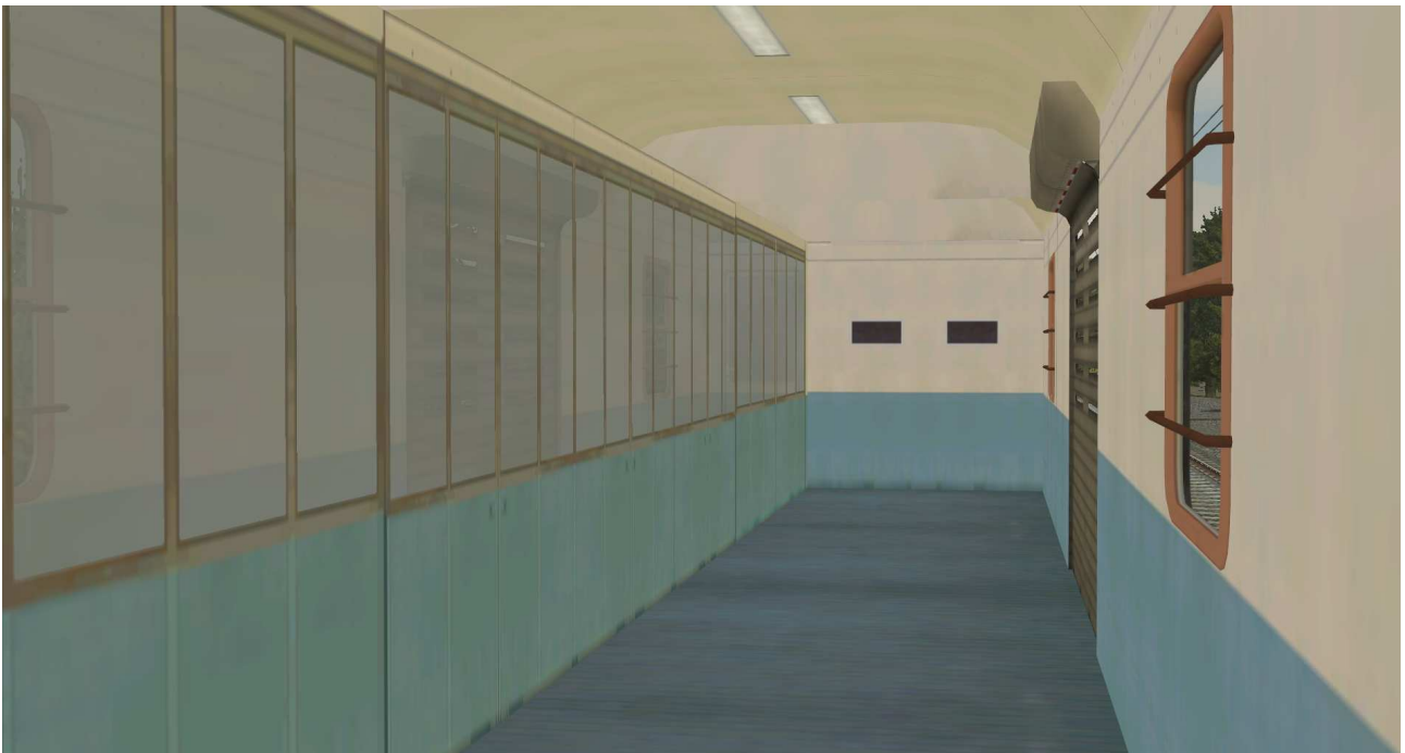
Gepäckwagen - Laderaum