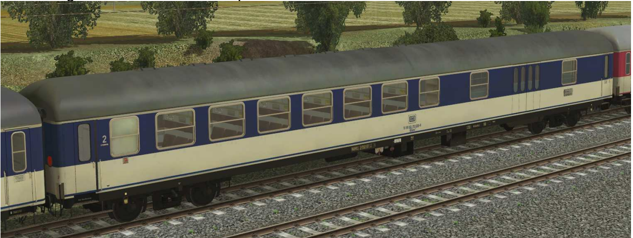
Sitz-/Gepäckwagen der Gattung BDüms273 POP-Lackierung blau in EpIV