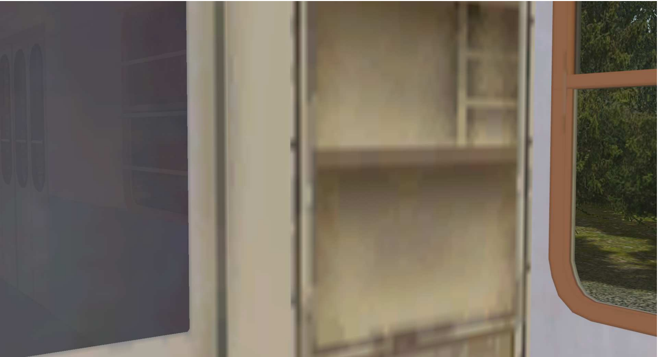
Gepäckwagen - Dienstabteil