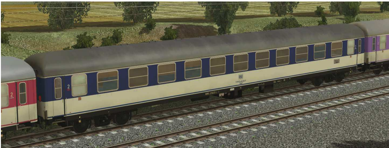
Liegewagen der Gattung Bcüm243 POP-Lackierung blau in EpIV