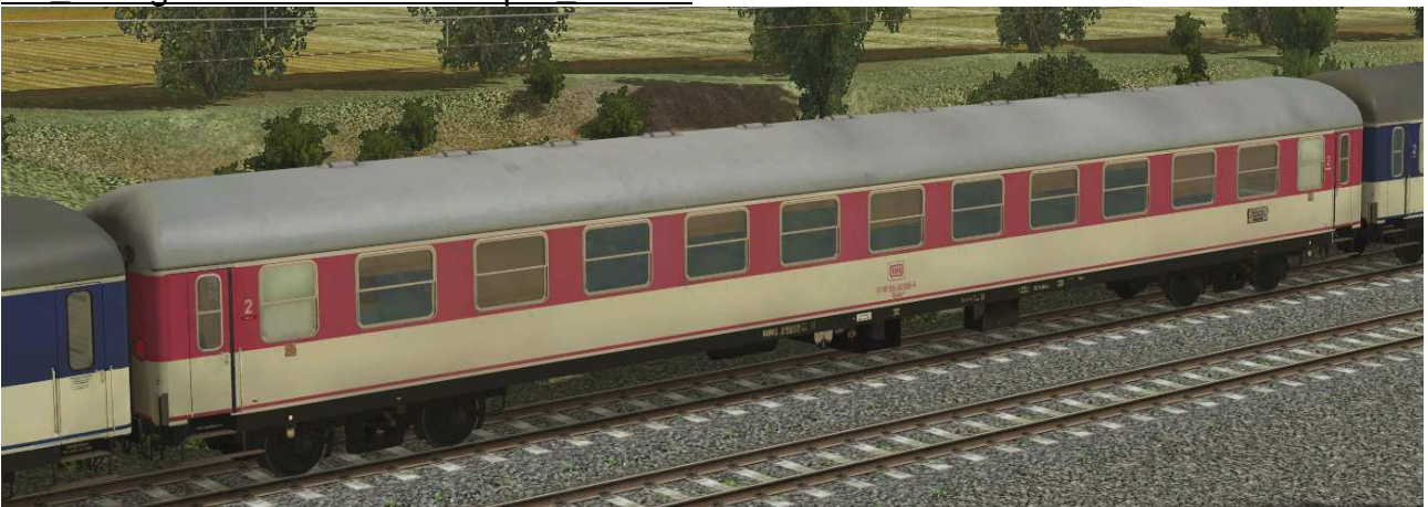
Liegewagen der Gattung Bcüm243 POP-Lackierung rot-violett (Sonderlackierung) in EpIV