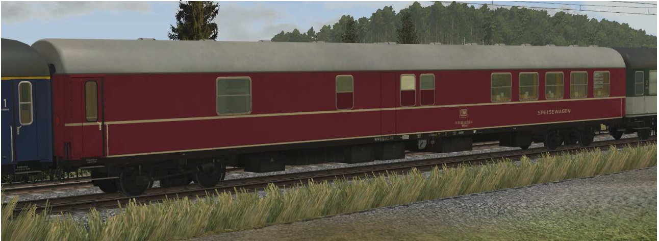
DB WRtm134-01-rot-EpIV SK2-v8

Speisewagen für den Turnus- und Urlauberverkehr, Einsatz aber auch in D-Zügen, Gattung WRüm 134, schwarzer Rahmen, EpIV