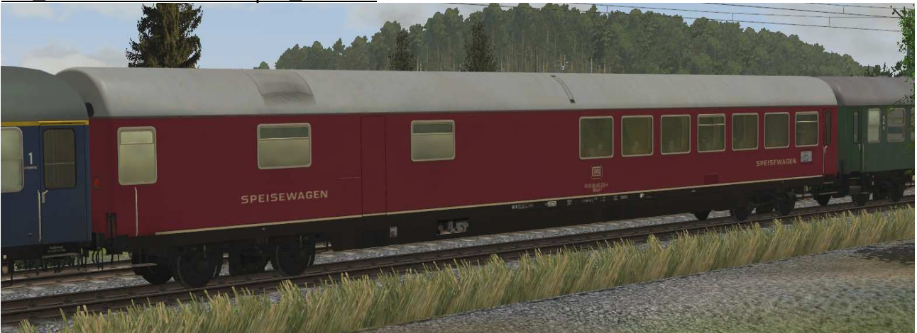
Speisewagen mit Klimaanlage der Gattung Wrümh132 der DB, Anstrichvariante 1, EpIV