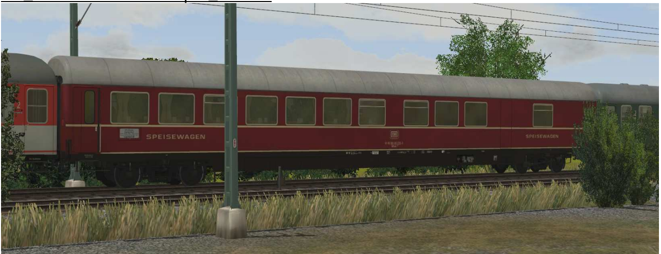
Speisewagen mit Klimaanlage der Gattung Wrümh132 der DB, Anstrichvariante 2, EpIV