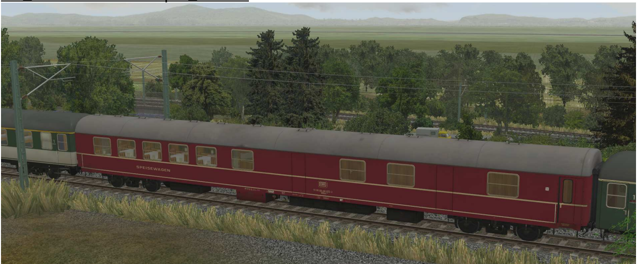
DB WRtm134-02-rot-EpIV SK2-v8

Speisewagen für den Turnus- und Urlauberverkehr, Einsatz aber auch in D-Zügen, Gattung WRtm 134, roter Rahmen, EpIV