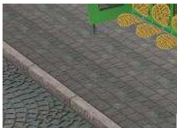
Gehwege Typ 1 Pflaster

Da es wenig Sinn macht eine grössere Anlage komplett mit diesen Gehwegen auszustatten, sind für beide Typen Endmodule und solche für die Bildung von Sackgassen dabei. Diese sind jeweils für Links und Rechts dabei, um ein kontinuierliches verlegen in einer Richtung zu erleichtern.