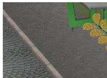
Gehwege Typ 2 Asphalt

Alle Gehwegmodule werden nach Gleisobjekte/Strassen installiert Die Modelle im Einzelnen: