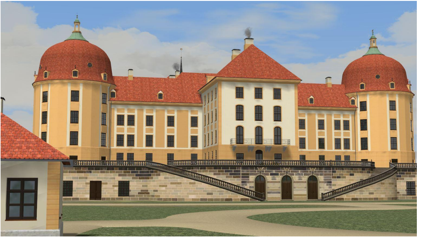
das Schloss von der Seite