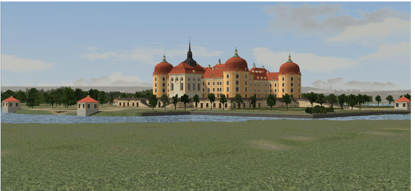
in seiner Gesamtheit