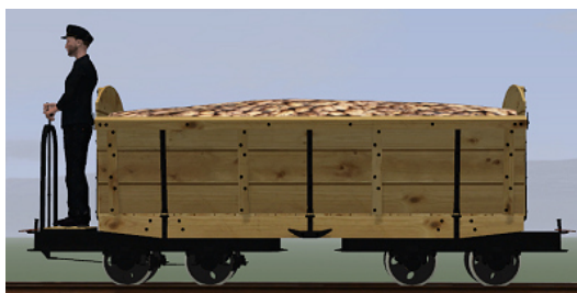
Rübenwagen 2, Lorenfw., gebremst, Fichte (Dateiname: R_Wg2_Br_F_KK1 – enthalten in: V11NKK10086)