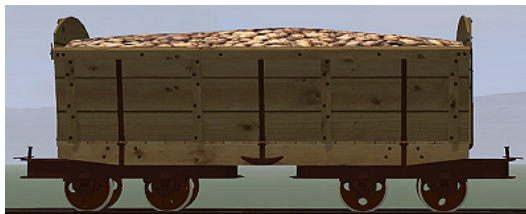
Rübenwagen 2,Lorenfw., Fichte Rost (Dateiname: R_Wg2_FR_KK1 – enthalten in: V11NKK10086)