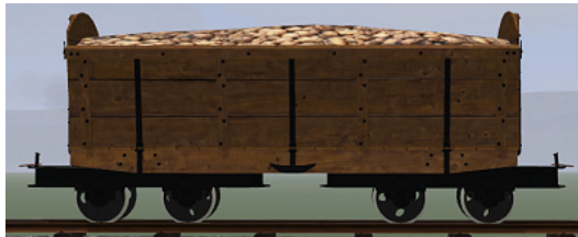
Rübenwagen 2,Lorenfw., Eiche dunkel (Dateiname: R_Wg2_E_KK1 – enthalten in: V11NKK10086)