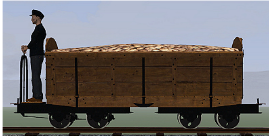
Rübenwagen 2, Lorenfw., gebremst, Eiche dunkel (Dateiname: R_Wg2_Br_E_KK1 – enthalten in: V11NKK10086)