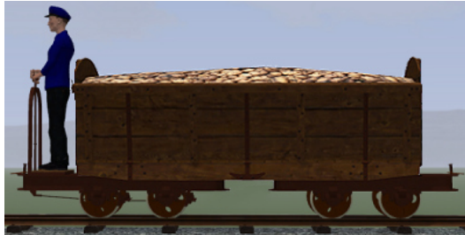
Rübenwagen 2, Lorenfw., gebremst, Eiche dunkel Rost (Dateiname: R_Wg2_Br_ER_KK1 – enthalten in: V11NKK10086)