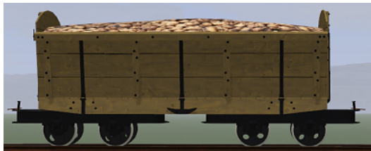
Rübenwagen 2,Lorenfw., Eiche hell (Dateiname: R_Wg2_hell_KK1 – enthalten in: V11NKK10086)