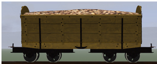
Rübenwagen 2,Lorenfw., Eiche hell 2 (Dateiname: R_Wg2_hell2_KK1 – enthalten in: V11NKK10086)