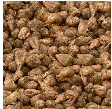
Zuckerrueben_KK1.png (vom Ostermodell 2018)

Die gebremsten Wagen haben jeweils einen Bremser, der per Schieberegler, Kontaktpunkt oder LUA eingeblendet werden kann. Die M nner haben wieder unterschiedliche Gesichter (andere als in V11NKK10085) und kleinere Farbunterschiede bei der Kleidung.