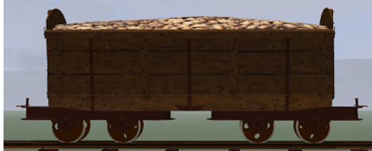
Rübenwagen 2,Lorenfw., Eiche dunkel Rost (Dateiname: R_Wg2_ER_KK1 – enthalten in: V11NKK10086)