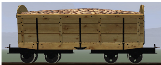
Rübenwagen 2,Lorenfw., Fichte (Dateiname: R_Wg2_F_KK1 – enthalten in: V11NKK10086)