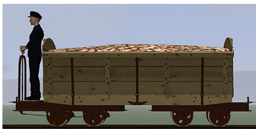
Rübenwagen 2, Lorenfw., gebremst, Fichte Rost (Dateiname: R_Wg2_Br_FR_KK1 – enthalten in: V11NKK10086)