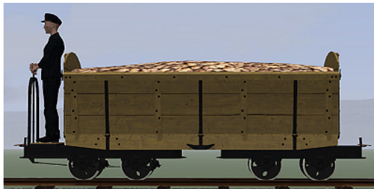
Rübenwagen 2, Lorenfw., gebremst, Eiche hell (Dateiname: R_Wg2_Br_hell_KK1 – enthalten in: V11NKK10086)