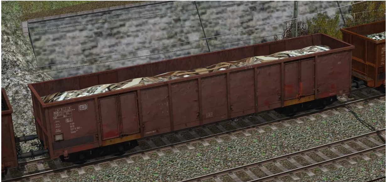
DB Eanos052-01 SK2-v7

offener vierachsiger Güterwagen Gattung Eanos052, mit einstellbarer Ladung Rundholz, Altholz und Schrott.