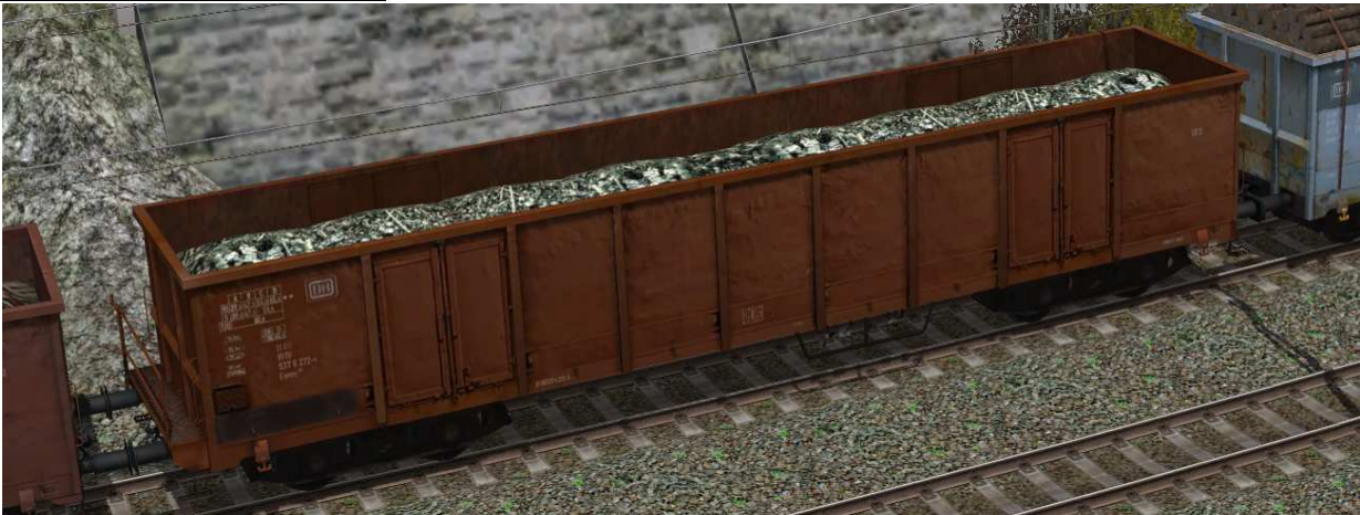
DB Eanos052-02 SK2-v7

offener vierachsiger Güterwagen Gattung Eanos052, mit einstellbare Ladung Rundholz, Altholz und Schrott.