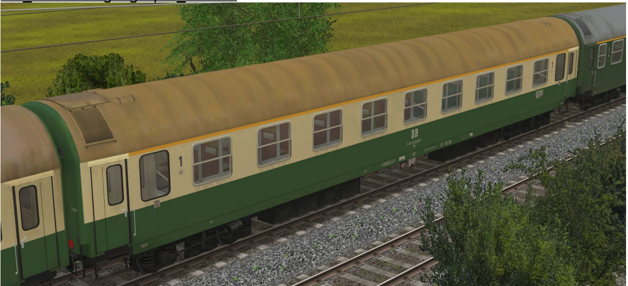
Abteilwagen 1.Klasse Typ Y der DR, Gattung Ame1941, grün-beige Lackierung, modernisiert