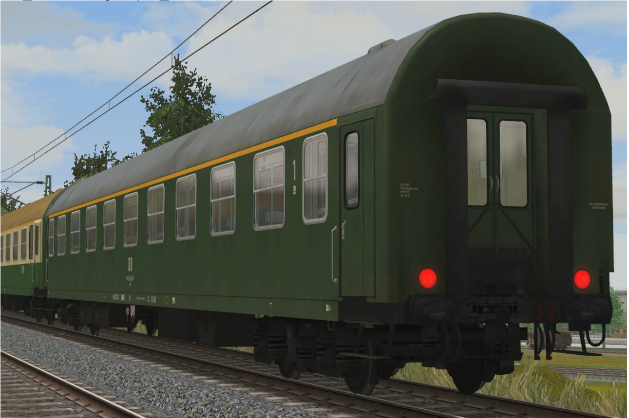
Abteilwagen 1.Klasse Typ Y der DR, Gattung Ame1941, grüne Lackierung - EpIV