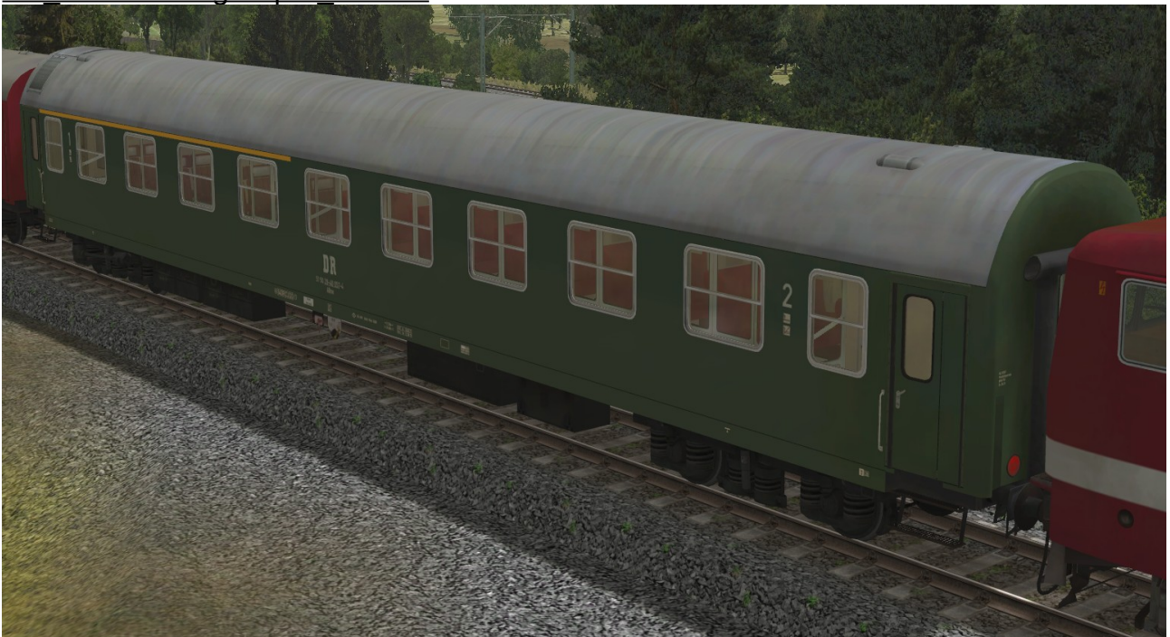
Abteilwagen 1./2.Klasse Typ Y der DR, Gattung ABme3941, grüne Lackierung - EpIV