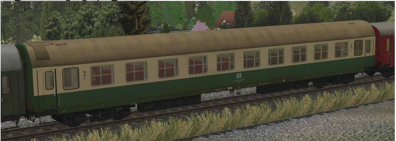
Abteilwagen 2.Klasse Typ Y der DR, Gattung Bme2041, grün-beige Lackierung, modernisiert