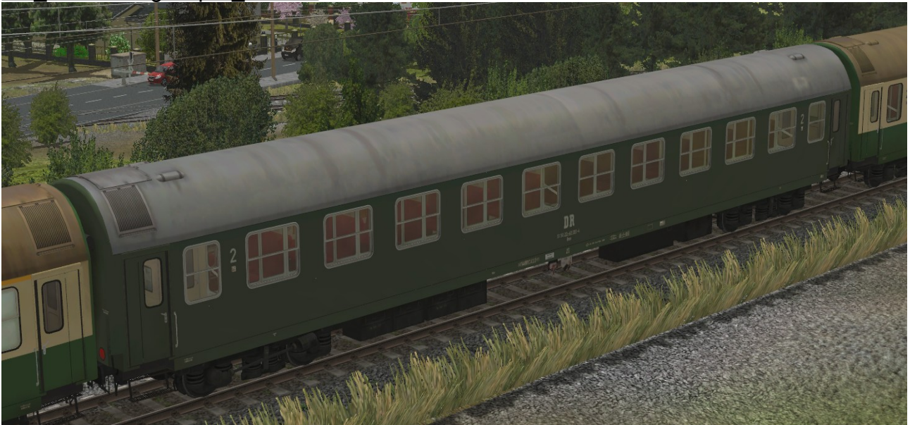
Abteilwagen 2.Klasse Typ Y der DR, Gattung Bme2041, grüne Lackierung - EpIV