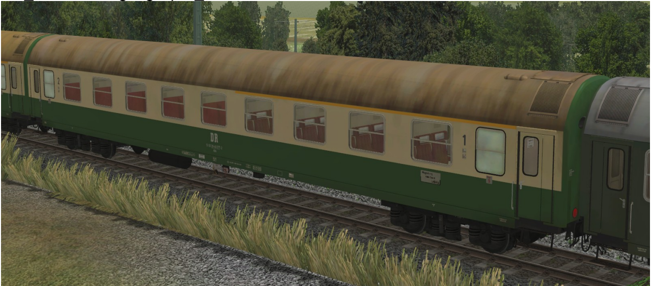
Abteilwagen 1./2.Klasse Typ Y der DR, Gattung ABme3941, grün-beige Lackierung, modernisiert