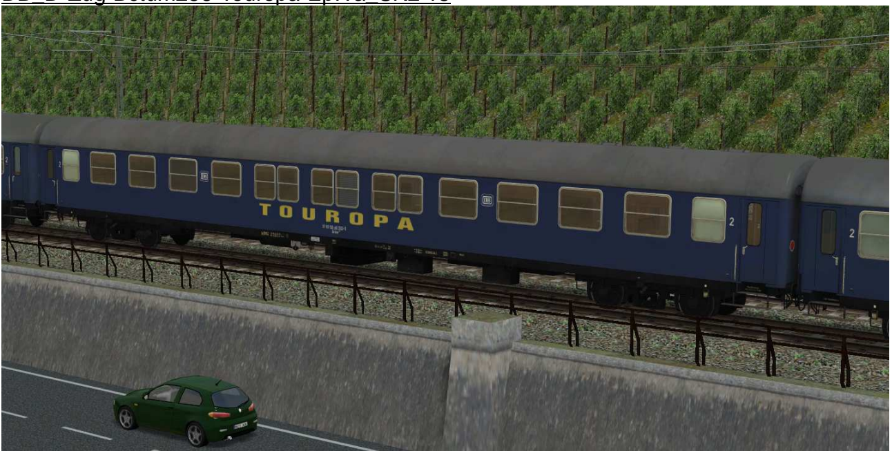
Liegewagen Bctm256 in blauer Lackierung, Epoche IV – Reisebüro „Touropa“