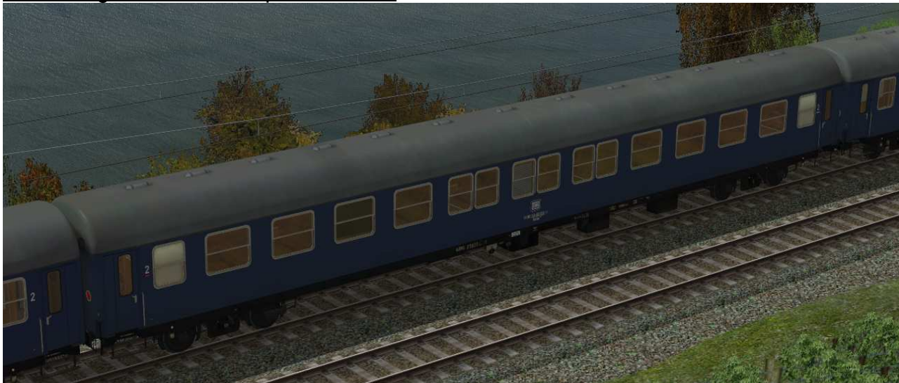
Liegewagen Bctm256 in blauer Lackierung, Epoche IVa