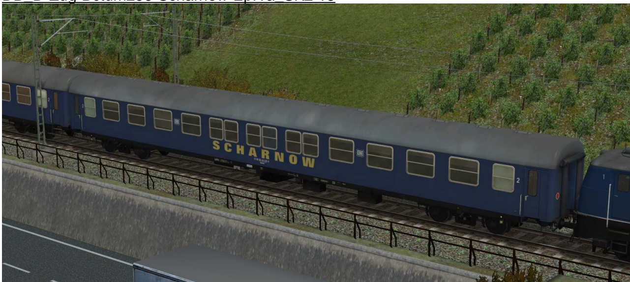
Liegewagen Bctm256 in blauer Lackierung, Epoche IV – Reisebüro „Scharnow“