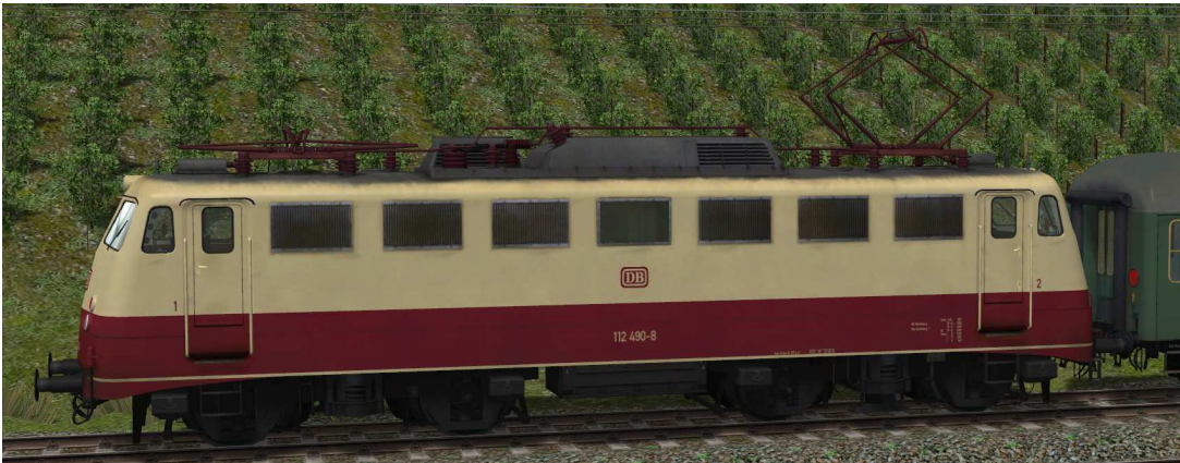
Stromabnehmer: Stromabnehmer 1 angehoben, Stromabnehmer 2 gesenkt

Die beweglichen Stromabnehmer können manuell oder über Kontaktpunkt angehoben und abgesenkt werden.