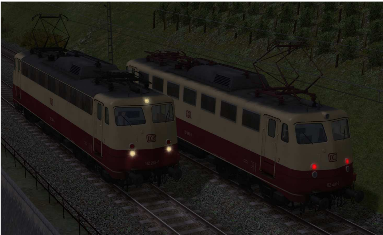
Beleuchtung: 2-Licht-Zugschluß- (rechts) und 3-Licht-Spitzensignal (links)

Die Beleuchtung wechselt fahrtrichtungsabhängig von Dreilichtspitzensignal auf 2-Licht-Zugschlußsignal. Auf der gekuppelten Seite ist das Licht ausgeschaltet.